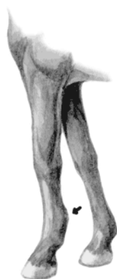
Рисунок – 1

C1. Определить и дать описание порокам конечностей, представленным на рисунках.