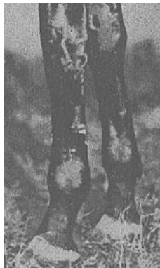
Рисунок – 2